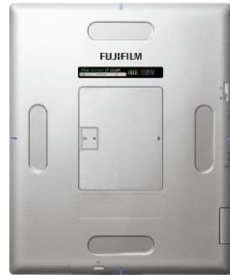
FDR D-EVO II G35 (14 x 17-inch model)